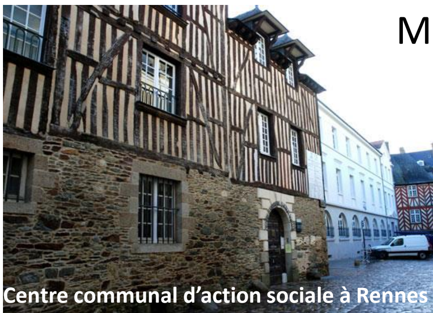
Centre communal d'action sociale à Rennes